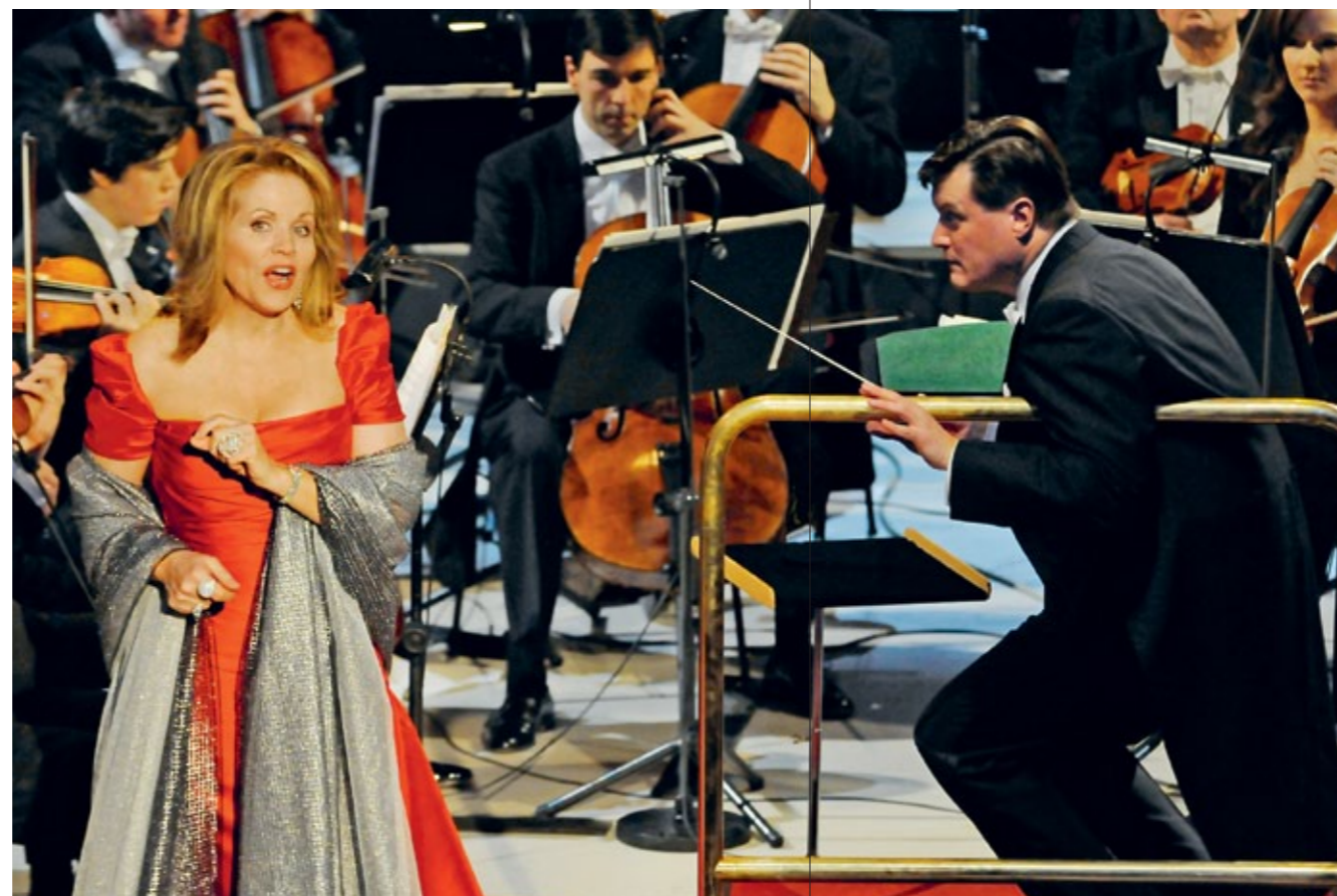
Christian Thielemann und Renée Fleming

Es ist eine Art innerer Gleichklang, der die Zusammenarbeit mit der Staatskapelle immer ausgezeichnet hat. Ich habe schon zahlreiche Konzerte mit den Dresdnern dirigiert, und das gemeinsame Musizieren war stets geprägt von einer unangestregten Selbstverständlichkeit, einer Normalität im besten Sinne, die ich nur als erfüllend beschreiben kann. Diese Erfüllung ist mit meiner neuen Position nun nicht mehr auf einzelne Engagements beschränkt. Hinzu kommt, dass ich mit den Dresdnern kein reines Konzertorchester dirigieren werde, sondern ein Ensemble, das in der Welt der Oper genauso zu Hause ist. Das habe ich in München doch etwas vermisst. Ein Konzert- und Opernorchester wie die Staatskapelle Dresden spielt anders als ein reines Konzertorchester. Musiker, die es gewohnt sind, mit Sängern zu arbeiten – deren Stimme nun einmal auch sehr von der Tagesform abhängt –, bringen eine Flexibilität in der Tongebung, Dynamik und Artikulation mit, die ein reines Konzertorchester nur selten erreicht. Mit der Sächsischen Staatskapelle Dresden kann ich Opern und Konzerte auf denkbar höchstem Niveau realisieren – und das bei einer fantastischen Akustik.