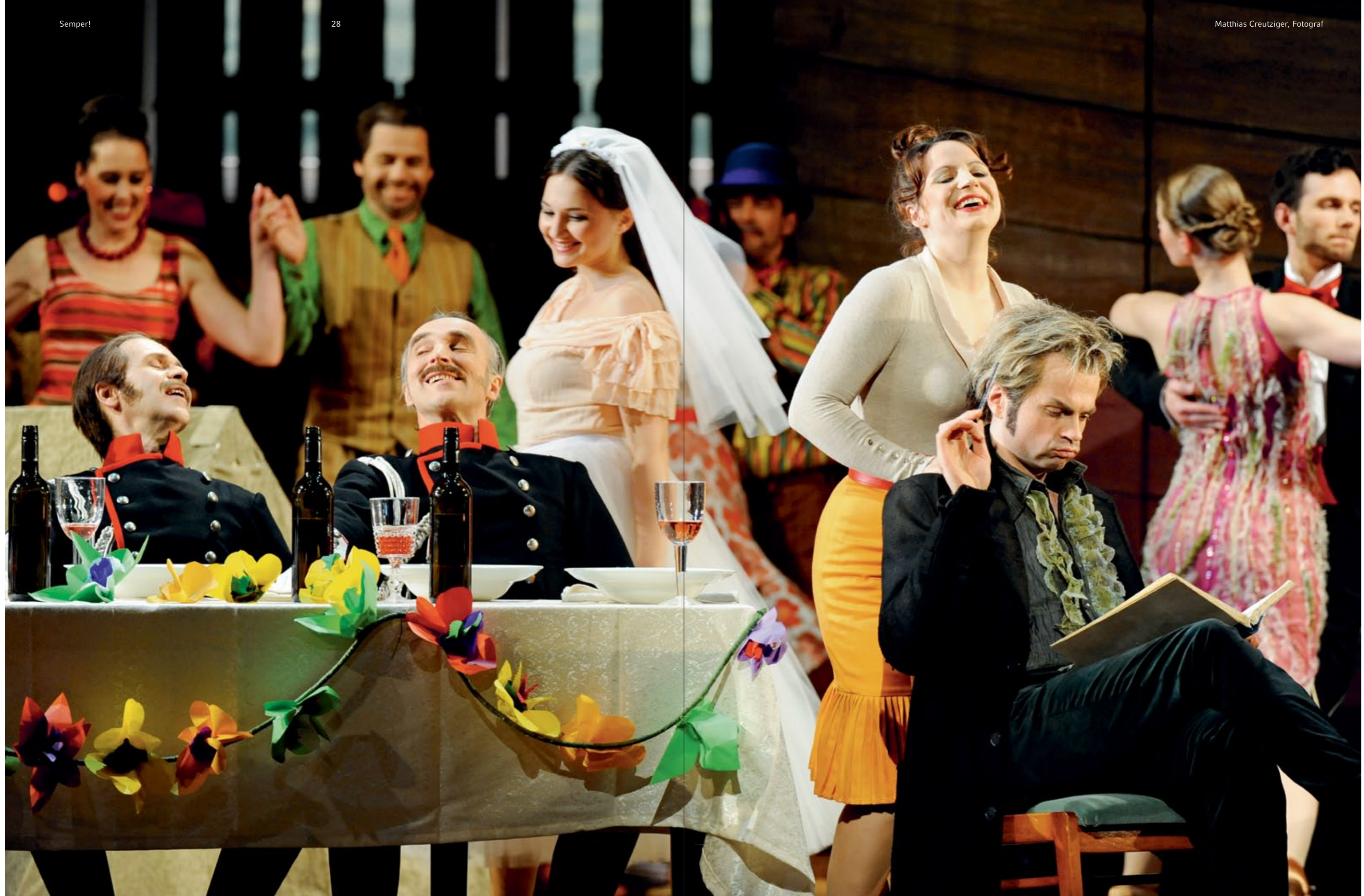
»L'elisir d'amore/Der Liebestrank«