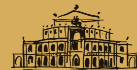
Stiftung zur Förderung der Semperoper Dresden

Wir laden Sie herzlich ein, Mitglied im Kuratorium der Stiftung zur Förderung der Semperoper und Teil einer exklusiven und lebendigen Gemeinschaft zum Wohle eines berühmten Opernhauses zu werden.