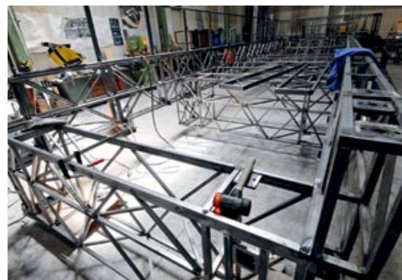
Stahlgerüst für »Wir erreichen den Fluss«

wird virtuell aufgebaut. In unterschiedlichen Farben leuchten die verschiedenen Baugruppen – die Abschnitte, die in der Schlosserei später zusammengeschweißt werden. »Wir versuchen, die Dekoration so zu konstruieren, dass sie auf der Bühne so schnell wie möglich zusammengebaut werden kann. Auf- und Abbauprozesse sind streng eingetaktet in den Bühnenbetrieb. Im Allgemeinen muss ein Bühnenbild innerhalb von drei Stunden stehen. Aber natürlich müssen wir uns dabei an die Höchstmaße halten. Was beispielsweise länger als 7,4 Meter ist, passt weder in den Aufzug zur Bühne noch in den Transporter.«