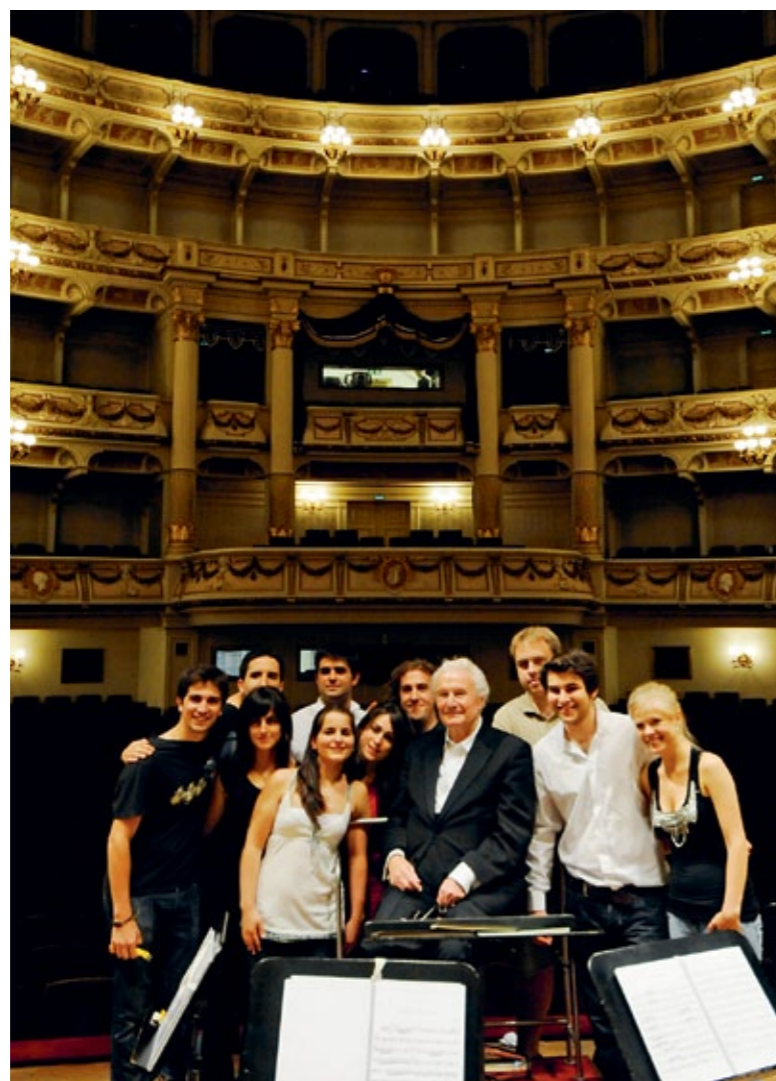
Mitglieder des Gustav Mahler Jugendorchesters mit Sir Colin Davis in der Semperoper (2011)

DIE STAATSKAPELLE INTENSIVIERT IHRE ZUSAMMENARBEIT MIT DEM GUSTAV MAHLER JUGENDORCHESTER