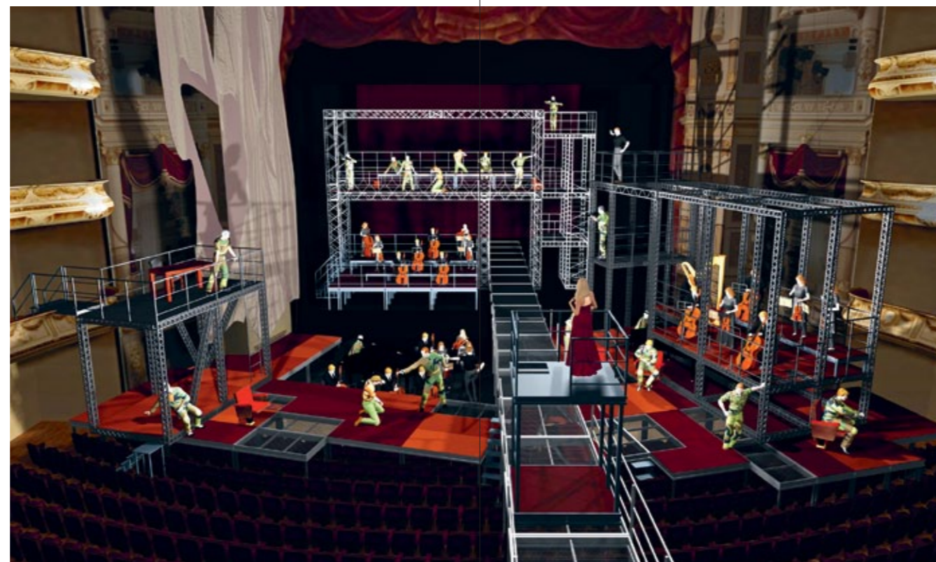
Bis in den Zuschauerraum reicht das Bühnenbild von Rebecca Ringst und Annett Hunger

Wir stehen an dem Flusse. Ist dort auch kein Steg, wir gehen durch. Wenn das Wasser zu tief ist, dann schwimmen wir. Ist die Strömung zu stark, dann baun wir ein Boot. Wir werden stehn auf dem anderen Ufer. Unser Schritt ist so sicher jetzt; wir können nicht mehr untergehn.