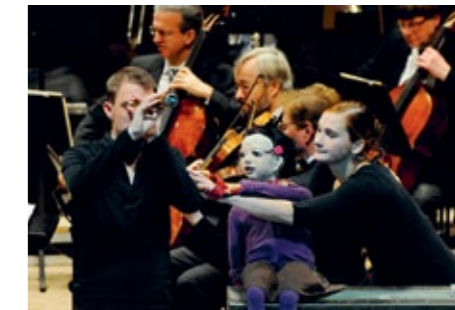
Kapelle für Kids