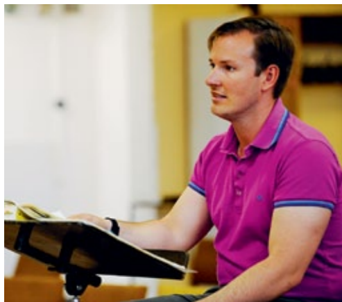
Dirigent Erik Nielsen

Bühne und Orchester sollten zu einer Einheit zusammenschmolzen werden, wie es sie noch nicht gegeben hatte. Die Instrumentalisten würden in ihrer Dienstkleidung, im Frack spielen, mitten auf dem Schlachtfeld, dem Richtplatz, bei Kaisers Picknick, bei der Exekution und beim Festakt. »Ich wollte mit der Musik so menschnah und wirklichkeitstreu sein wie nur möglich. Während eines Standgerichts spielt die allwissende Orgel. Der Tod der alten Frau, ihr Enkelkind im Arm, am Schluss des ersten Teils, in den Strudeln des Flusses, wird durch eine zentrifugale Musik dargestellt, die in kanonischen Überlappungen in den drei Orchestern um die Szene rotiert wie im Wirbelsturm.« Hans Werner Henze