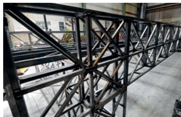
Stahlgerüst für »Wir erreichen den Fluss«

VOM ENTWURF ZUM STAHLGERÜST – DIE KONSTRUKTIONSABTEILUNG